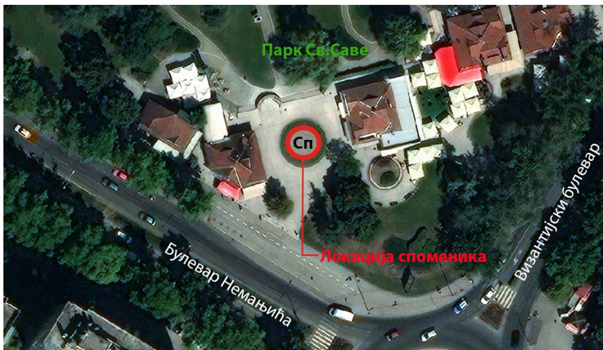
Илустрација 2 – Непосредно оружење предложене локације за Споменик ненасиљу